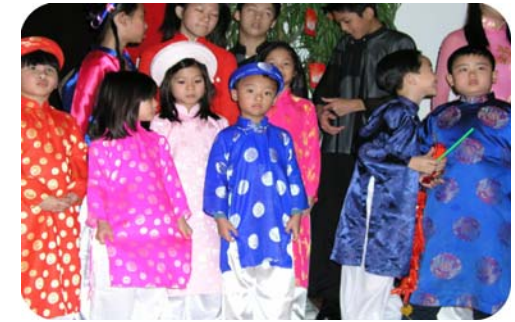
Các Em Học Sinh Đón Tết

Mỗi năm học của từng cấp lớp gồm có hai khóa, học phí của mỗi khóa là 60 đồng. Trường mở cửa vào ngày Chủ Nhật hàng tuần, từ 9 đến 12 giờ sáng. Không có khóa hè.