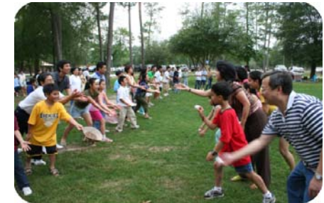
Sinh Hoạt Ngoài Trời