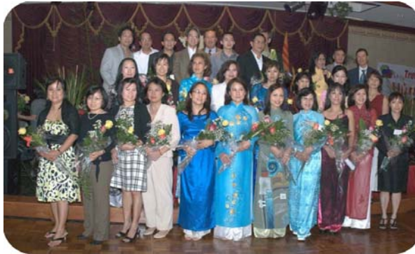
Các thầy cô trường VNHV trong ngày Tiệc Cám On Thầy Cô

Song song với ban điều hành, trường Việt Ngữ Hùng Vương còn có một hội Phụ Huynh Học Sinh do các phụ huynh bầu lên để đóng góp tích cực trong công việc chung của trường. Hội Phụ Huynh Học Sinh là môi trường hoạt động lý tưởng cho các phụ huynh muốn giúp trường mà không muốn làm thầy cô. Một trong những sinh hoạt của hội là thực hiện những buổi hội thảo cho phụ huynh chia sẻ kinh nghiệm về những vấn đề thực tế hàng ngày.