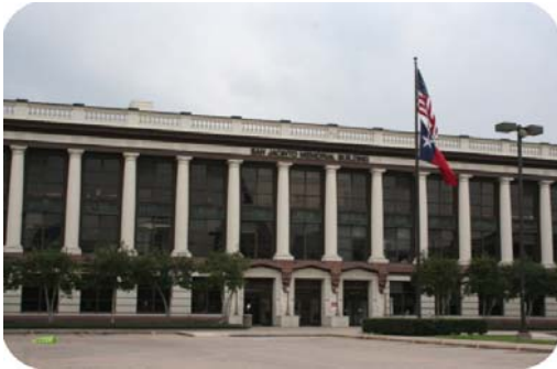
Trường VNHV tại Houston Community College - Downtown Campus